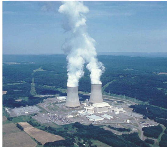
Planta de energía nuclear en Susquehanna (EEUU).

La energía nuclear es una alternativa realista para la producción estable de electricidad, que funciona de día y de noche y no depende de los vientos. No produce emisión de gases de efecto invernadero y puede constituir una gran herramienta en la lucha contra el cambio climático. No podemos permitirnos el lujo de cerrarnos a la opción nuclear sin antes un serio debate y estudio. Las centrales nucleares son hoy más seguras que antes de Chernóbil y representan una de las formas más seguras de producir electricidad a gran escala y, aunque sin duda hay que mantener la vigilancia y aumentar las medidas de seguridad si es preciso, debemos huir de miedos irracionales y comparar seriamente los riesgos de las diferentes fuentes de energía.